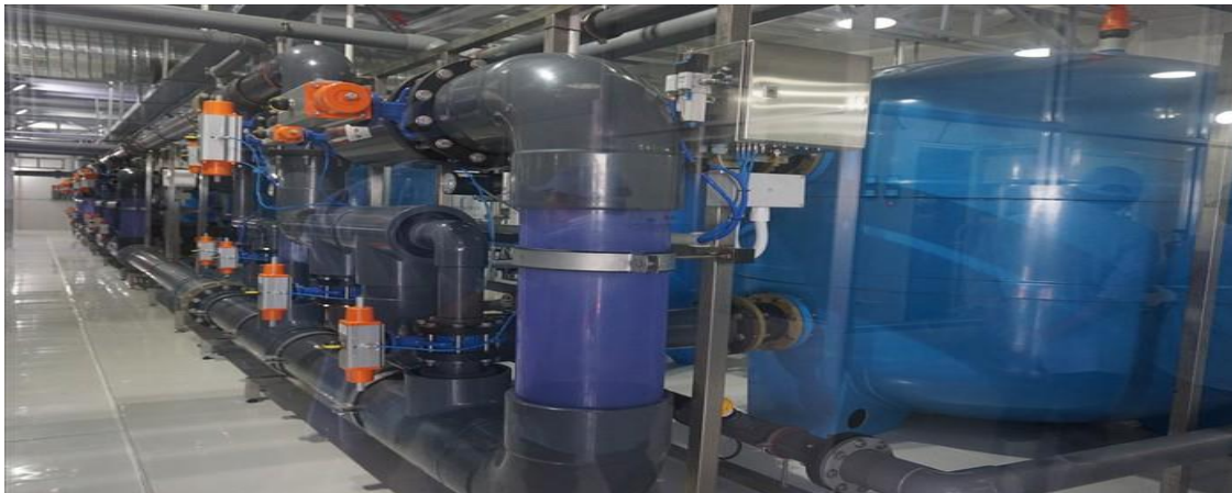
Nhà máy xử lý nước công nghệ cao áp dụng cho sản xuất tôm giống lớn nhất Việt Nam tại Việt Úc Bạc Liêu.