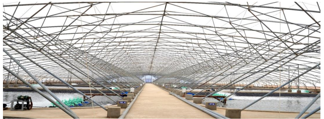
“Resort” cho tôm thuộc Tập đoàn Việt Úc tại Bạc Liêu tại P. Nhà Mát, Tp. Bạc Liêu, tỉnh Bạc Liêu